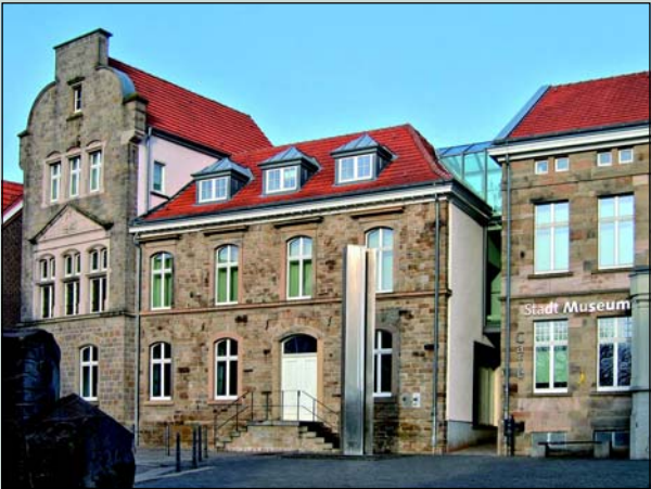
Das Deutsche Aphorismus-Archiv (DAphA) hat seinen Sitz im Neben- gebäude (2. Etg.) des Stadtmuseums Hattingen.