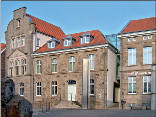
Das Deutsche Aphorismus-Archiv (DaphA) hat seinen Sitz im Neben- gebäude (2. Egt.) des Stadtmuseums Hattingen.